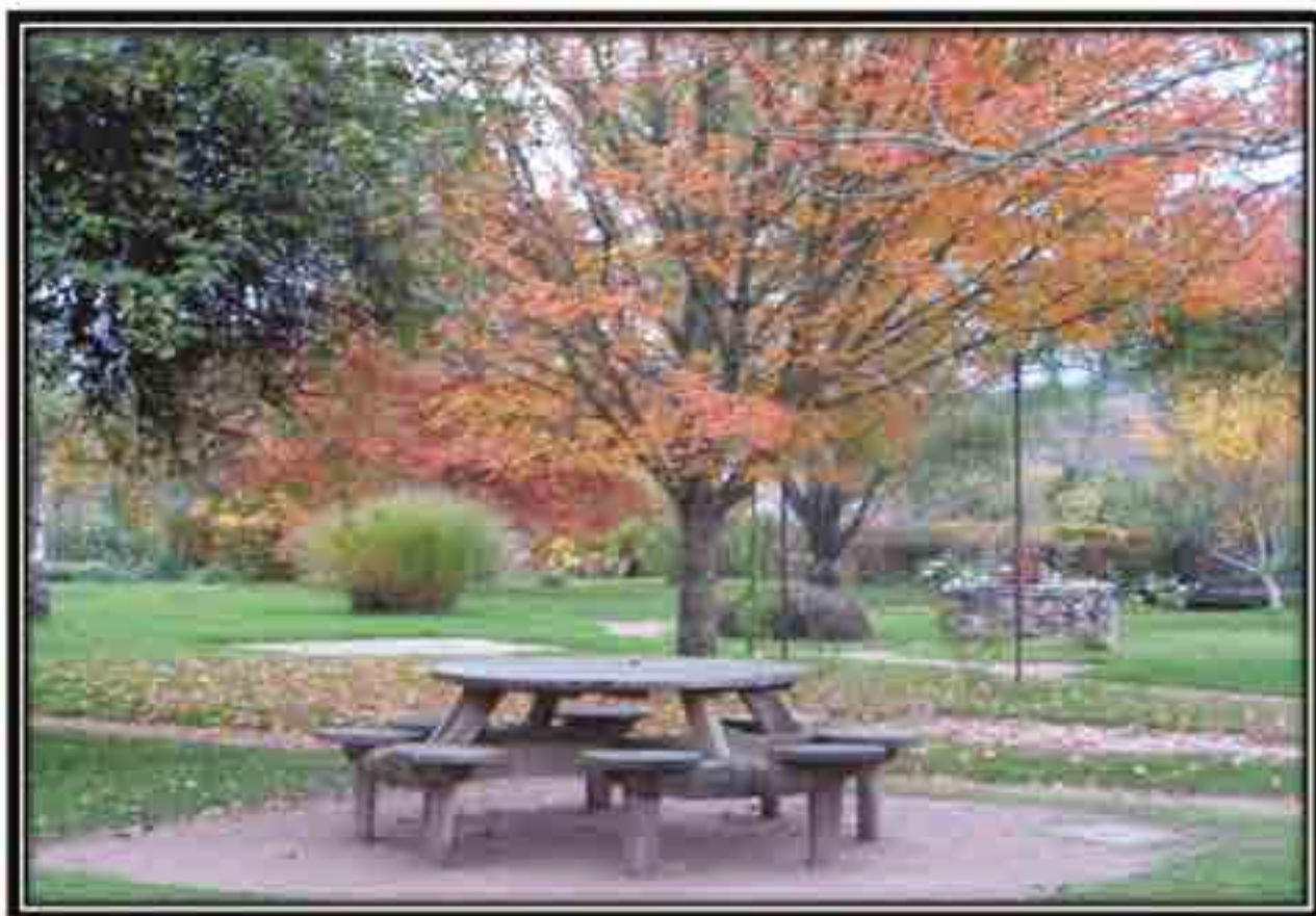
La Roseraie a pris ses couleurs d'automne