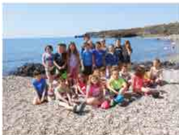
Lors du voyage en classe de mer