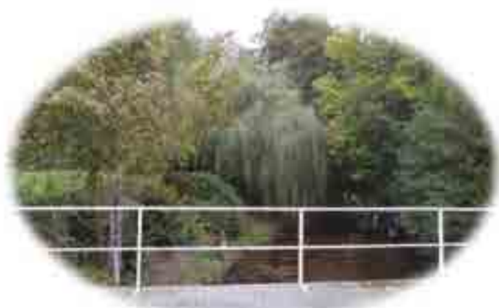
1. Vue du pont de Place