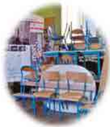
Vente fictive du matériel qui n'aurait plus d'utilité ✓