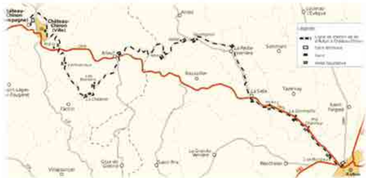
Trajet du tacot

En 1789, il n'y avait qu'un courrier par semaine reliant Château Chinon à Autun. C'était une « charrette couverte » qui partait le samedi, arrivait à Autun vers 16h et revenait le dimanche. Dès 1847, le comte d'Esterno, alors maire de La Celle, établit un projet de chemin de fer transversal de l'est à l'ouest passant par l'autunois qui relierait entre autre Château Chinon à Autun, desservant donc la commune. Ce n'est qu'en 1891 que les études démarrent vraiment, la ligne est déclarée d'utilité publique en 1897 et la mise en service a lieu en 1900. La ligne fonctionnera jusqu'en 1936.