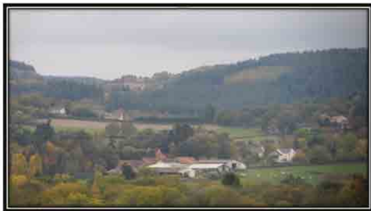
Vue depuis Le Chêne