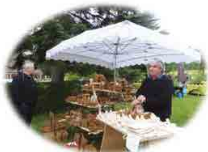
➤ un exposant habitué de la fête

Le dernier week-end de mai c'est le rendez-vous incontournable de la fête Art et Fleurs en Morvan organisée par l'association de la Roseraie des Villages de France. Cette année encore de nombreux exposants artisans, artistes, horticulteurs ont proposé un éventail très large de créations. Certains exposants étant présents régulièrement ont leurs clients fidèles qui ne manquent pas de revenir acheter leurs produits. Il y a néanmoins aussi de nouveaux stands ce qui offre également de la diversité.