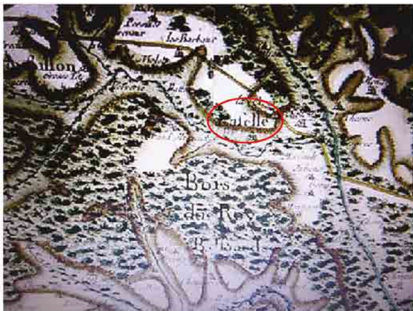
Extrait de la carte de Cassini, feuille d'Autun, XVIIIe siècle