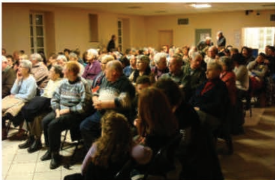
Le public est venu nombreux

casino municipal de Nice. L'auteur a écrit cette pièce selon les règles du Vaudeville : des personnages qui ne devraient pas se rencontrer se retrouvent réunis. L'histoire : pour rompre la monotonie de sa vie conjugale, un homme d'affaires s'installe chez sa maîtresse. Son intimité est bien vite troublée par des arrivées inattendues. Tout d'abord sa fille Christiane qui a découvert l'adresse de sa maîtresse, puis son fils Jean-Pierre qui lui annonce ses fiançailles avec une jeune Camerounaise. Ce sont également sa femme et sa belle-mère qui sonnent à la porte de sa maîtresse. Cette pièce, mise en scène par M. Hervé CHARLES, superbement interprétée, a conquis le public.