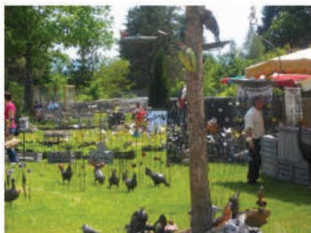
←Décorations de jardins

Rendez-vous incontournable du dernier week-end de mai, la fête de la Roseraie a connu cette année encore un vif succès. En effets les amoureux de la nature et des plantes peuvent trouver des rosiers, mais également toutes sortes de plantes ainsi que des artisans venus parfois de loin pour nous présenter leurs productions et créations.