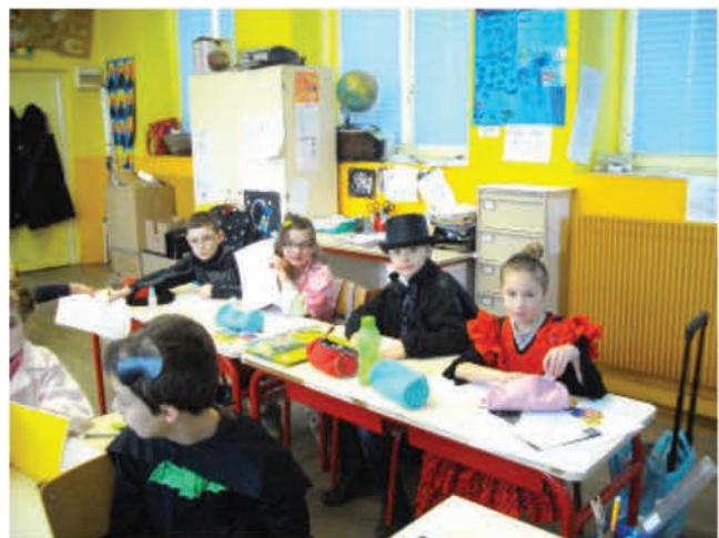
Les enfants ont fêté Mardi Gras à l'école