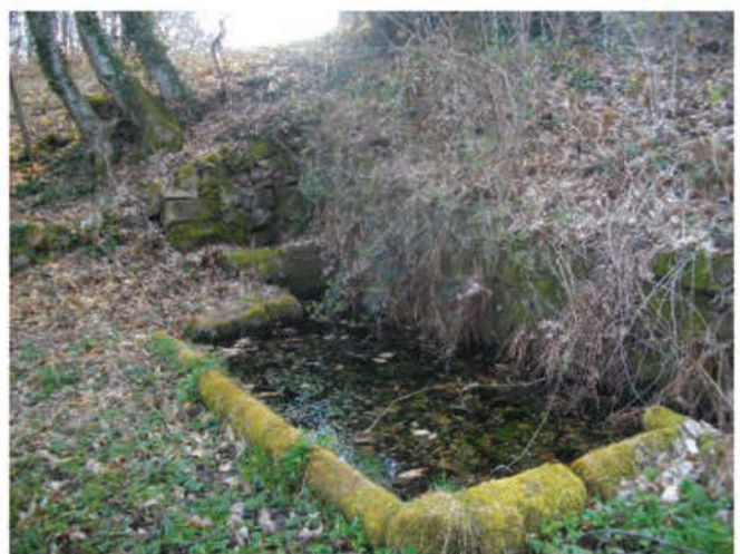
Lavoir du Mizieux