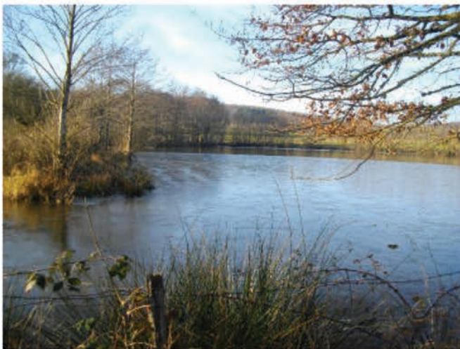
Etang des Juliens

Pour les amoureux de la nature, notre commune regorge de jolis petits coins à découvrir au détour d'une promenade :